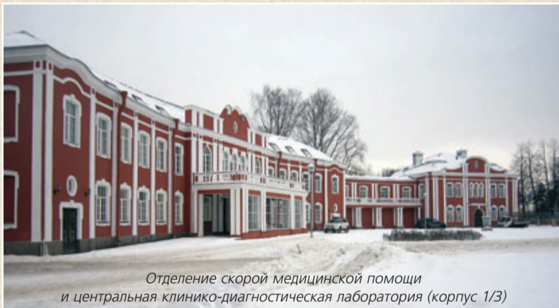
Отделение скорой медицинской помощи и центральная клиничко-диагностическая лаборатория (корпус 1/3)

Характеризуя учебное направление деятельности, О.Г.Хурцилава отметил, что наряду с повышением количественных показателей работы (в 2014 г. число обучающихся студентов достигло 4165 человек) значительно повысился уровень качества преподавания. Число задолженностей по выходу на сессию сократилось, а число стипендиатов выросло. Высокими остались и показатели в последипломном образовании. В 2014 г. на обучение по программам ординатуры и интернатуры было принято 1146 человек, на курсах повышения квалификации обучения прошли 30267 врачей. Причем весомая часть обучалась по договорам об оказании платных образовательных услуг, что принесло значительные доходы от внебюджетной образовательной деятельности. В описании учебной работы особый акцент был сделан на системную модернизацию медико-профилактического направления для оптимизации образовательных процессов с учетом компетентностного подхода в подготовке выпускников.